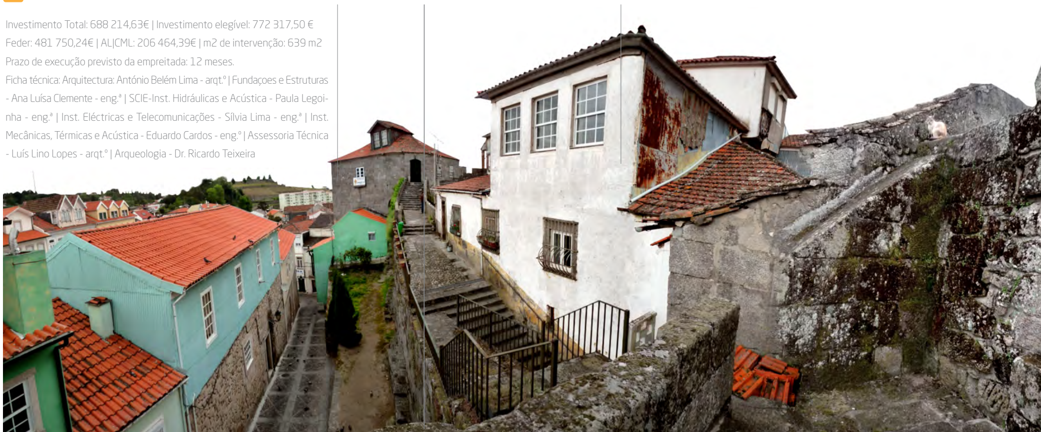
Nível 1 LojaExpo | Artesanato